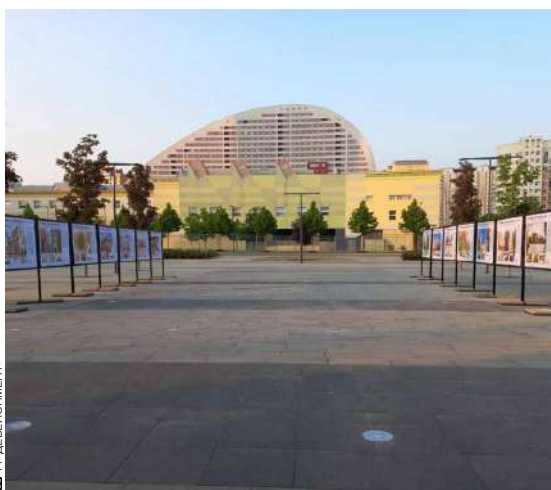
Выставка «Жизнь в окружении истории» в парке «Лодынский поле»

В свой юбилейный год компания реализует множество социальных и гуманитарных проектов, расширяя свою публичную деятельность. Для застройщика юбилей – не просто праздник, это драйвер развития как самой компании, так и важных для нее направлений, связанных с социальной ответственностью перед жителями города.