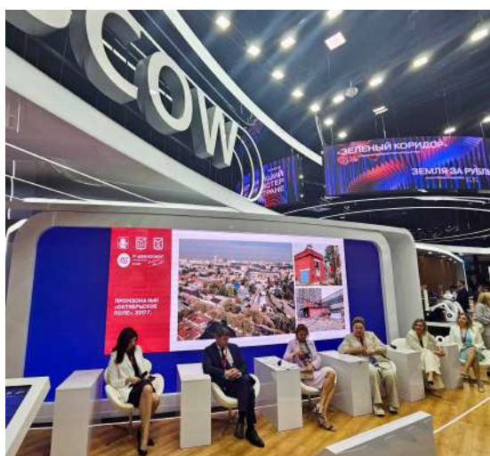
Участники сессии «Программа комплексного развития территорий как драйвер изменения городов»

Продолжение истории о реализации мероприятий, приуроченных к юбилею «РГ-Девелопмент», читайте на страницах нашего издания уже через месяц.